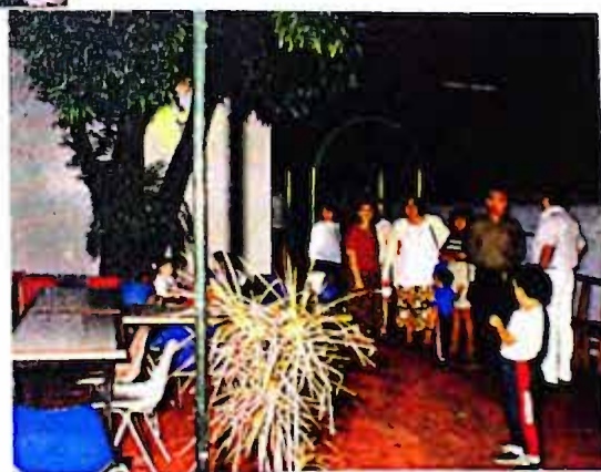
Vista patio sede gremio