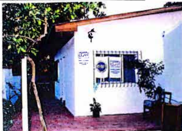
Vista exterior Albergue

El pasado 9 de mayo se inauguró el albergue "Negro Silva" que se contruyó en la sede del gremio, ya se encuentra habilitado para el uso de los afiliados que así lo requieran, también se cuenta con un patio de 42 m 2 para uso de fiestas familiares.